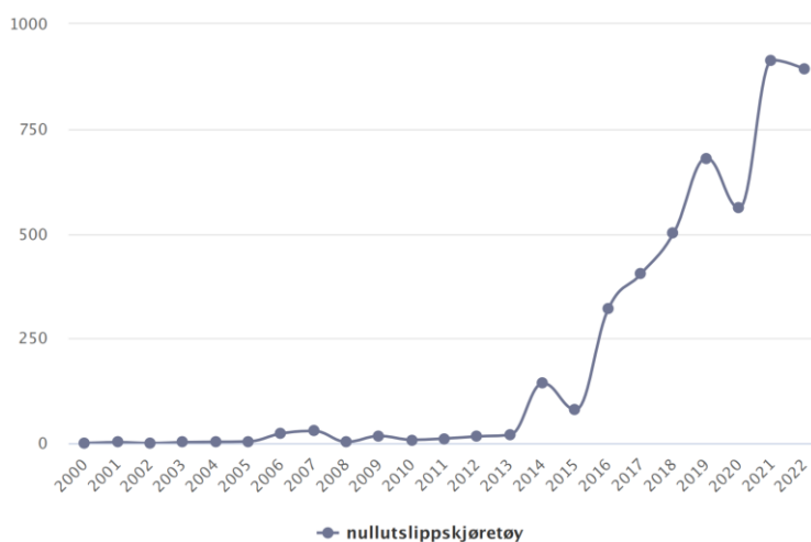
Figur 2. Bruk av ordet «nullutslippskjøretøy» i norske media 2000-2022. Data fra Atekst, 17. januar 2023.