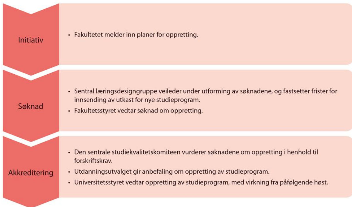
Figur 4: Saksflyt for oppretting av studieprogram

Fakultetsstyret vedtar å søke om oppretting og nedlegging av studieprogram med utgangspunkt i fakultetets strategiske plan for studieporteføljen. Endelig søknad om oppretting av nye studieprogram skal vurderes av den sentrale studiekvalitetskomiteen, som gir sin anbefaling om oppretting til utdanningsutvalget. Utdanningsutvalget gir anbefaling om oppretting og nedlegging av studieprogram til universitetsstyret. Universitetsstyret fatter endelig vedtak om oppretting og nedlegging.