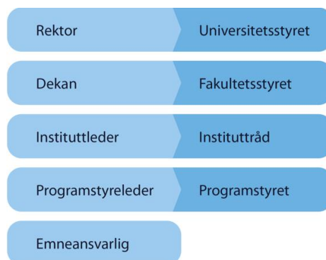
Figur 2: Ansvarsroller for det systematiske studiekvalitetsarbeidet

Ansvar for det systematiske kvalitetsarbeidet i utdanningene følger de faglige rollene som beskrevet i tabellen nedenfor. Figuren viser de funksjonene som har et formelt ansvar i det systematiske kvalitetsarbeidet ved UiB.