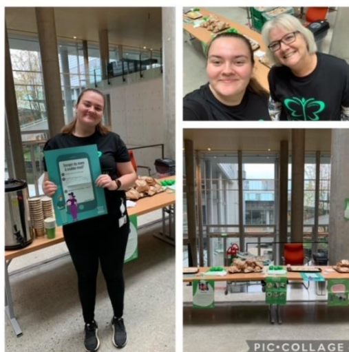
Bilder fra standsmarkering fra verdensdagen ved det medisinske fakultet.