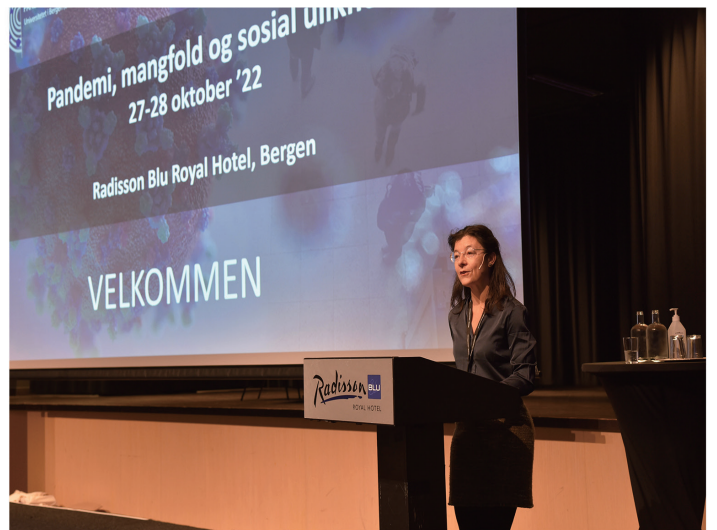
KONFERANSEN I TALL: 105 deltakere, 9 poster, 3 paneldebatter, Bred deltakelse fra offentlig sektor (25 %), høyere utdanning (35 %), frivillige organisasjoner (35 %) og andre (5 %).