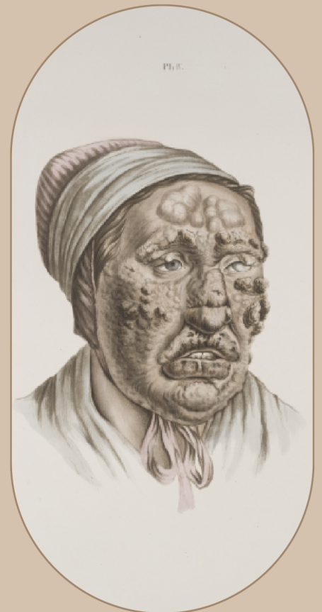
Illustrasjon av leprapasient, 1847.

St. Jørgens hospital i Bergen, som no er lepramuseum, er i eit testamente frå 1411 skildra som «det nye hospitalet i Marken». Men det skulle komme mange fleire institusjonar der dei samla norske spedalske, spesielt då sjukdommen herja på 1800-talet. Då kom fleire eigne sjukehus for forskning og pleie av dei spedalske: Forskingssykehuset Lungegaardshospitalet og Pleiestiftelsen i Bergen, Ræknes Pleiestiftelse i Molde og Reitgjerdet i Trondheim. Var du først komen innanfor dørene til eit av desse sjukehusa, så kunne du rekne med å bli der livet ut; du sov der, åt der, og var der resten av dine dagar.