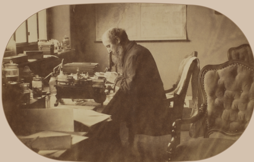
Armauer Hansen ved mikroskopet.

Medan vi i Noreg ofte brukar uttrykket «lepra» om sjukdommen, så brukast ofte namnet «Hansens disease» i utlandet, etter nordmannen Armauer Hansen.