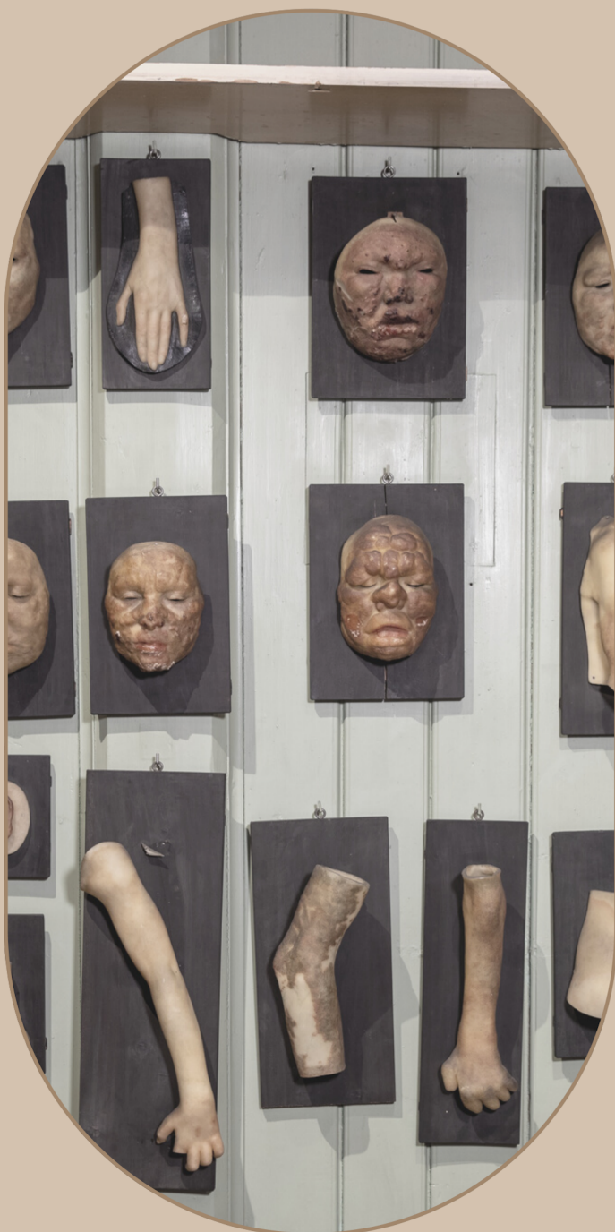
Voksmasker av pasientar med lepra.