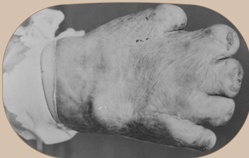
Handa til ein lepra-pasient, kring 1925.

Ein skal ikkje ha mykje fantasi for å tenke seg kor forferdeleg det må ha vore for ein ungdom, ei mor eller ein far, for ikkje å snakke om eit barn. Det var rett og slett ei knust framtid og i dei fleste tilfelle ein einvegsbillett til eit trist liv og ein smertefull død.