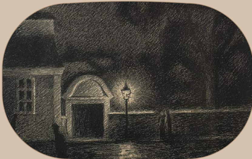
Inngangspartiet til St. Jørgens hospital. Teikning av Moritz Kaland, kring 1900.

Det var også knytt mykje overtru til lepra. Ein straff frå Gud, meinte mange. Dei spedalske vart behandla deretter – som som det var deira eigen feil. Å få denne sjukdommen, der det ikkje fanst