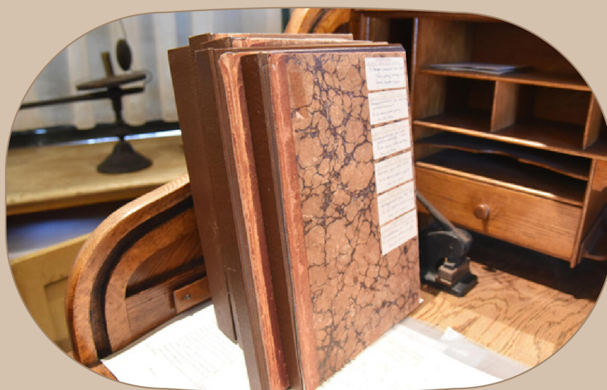
Lepraregisteret fins framleis på Universitetet i Bergen.

I tråd med at legane kom på bana, så vart Nasjonalt lepraregister innført i Norge i 1856. Ein ville prøve å få meir kontroll over sjukdommen – og auke kunnskapen. Dette registeret, med over 8000 personar innlemma, er rekna som verda sitt første nasjonale pasientregister. I dag er registeret ein del av UNESCO sitt program for Verdas Hukommelse.