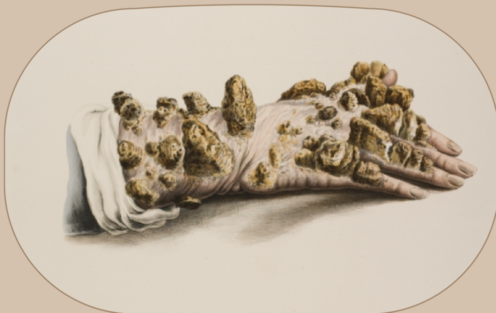
Illustrasjon av hand med lepra, 1847.

TEKST: Marion Solheim, kommunikasjonsansvarleg ved Det medisinske fakultet, UiB