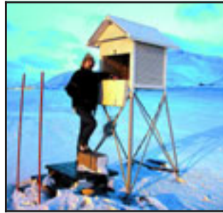
MÅLESTASJONEN: Bildet er hentet fra Meteorologisk institutts værstasjon ved Longyearbyen, og viser reparasjon av en vindmast på Platåfjellet. I dette området registrerte forskerne i 2006 den mest ekstreme oppvarmingen på hele kloden.