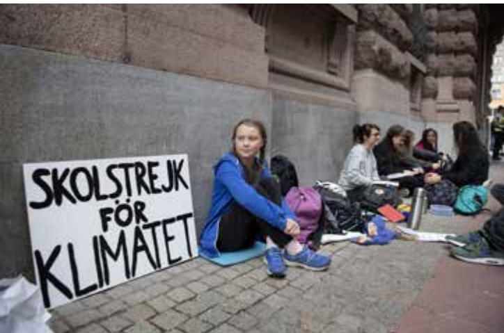
FREMTIDEN: Carsten Jensen finner håp i Greta Thunberg og andre ungdommer som den siste tiden har streiket for klimaets skyld