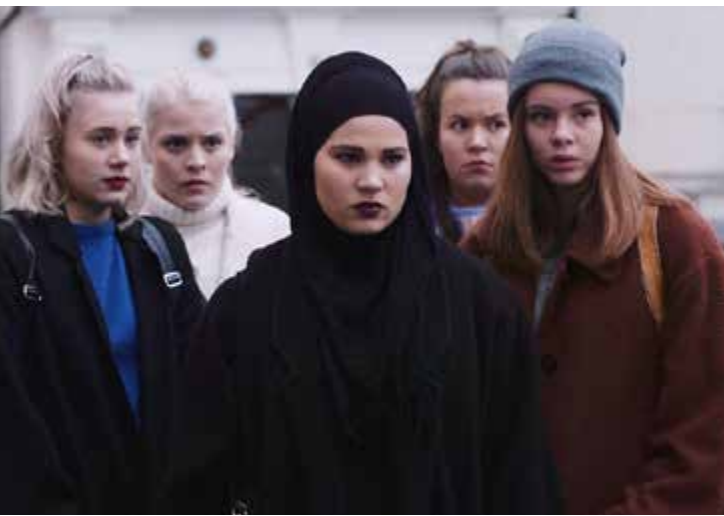
FASCINERER: Gjengen fra NRKs «Skam» gjør inntrykk på Carsten Jensen. Fra venstre: Noora (Josefine Frida Pettersen), Vilde (Ulrikke Falch), Sana (Iman Meskini), Chris (Ina Svenningsdal) og Eva (Lisa Teige).