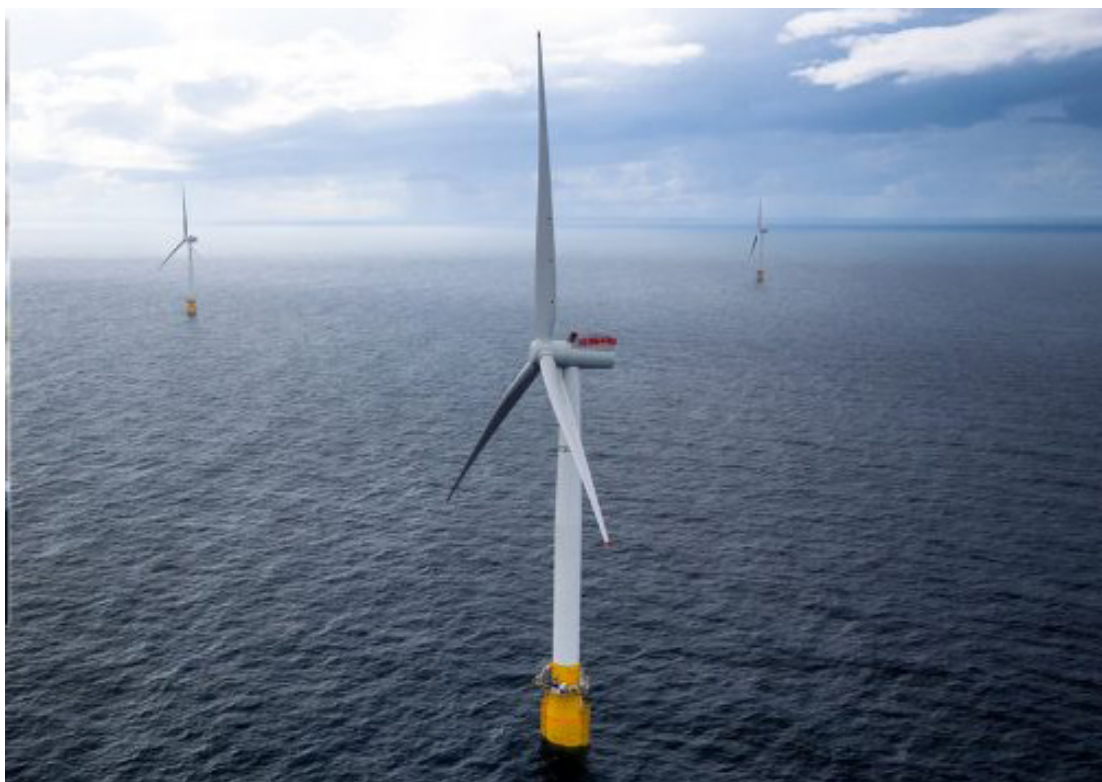
PÅ VENT: Equinor venter på om de får Enova-støtte til Hywind Tampen, verdens hittil største flytende havvindprosjekt i Nordsjøen.