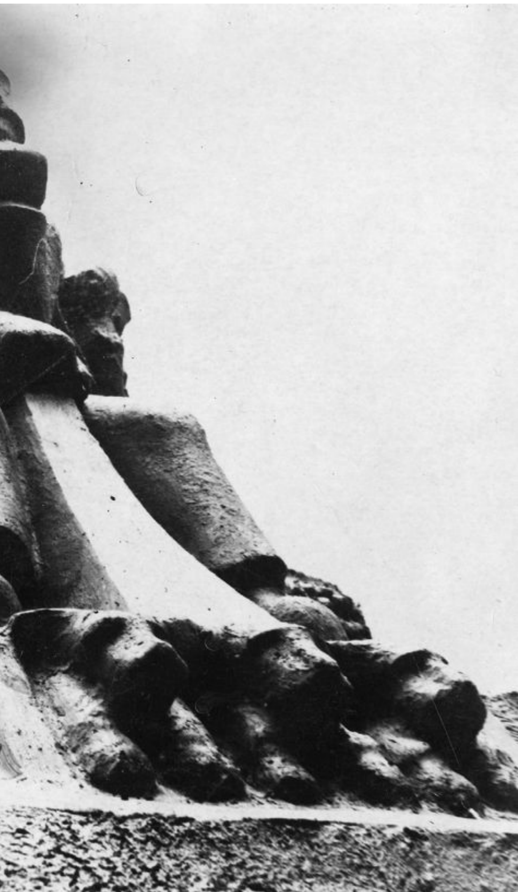
med Fridtjof Nansen i front.