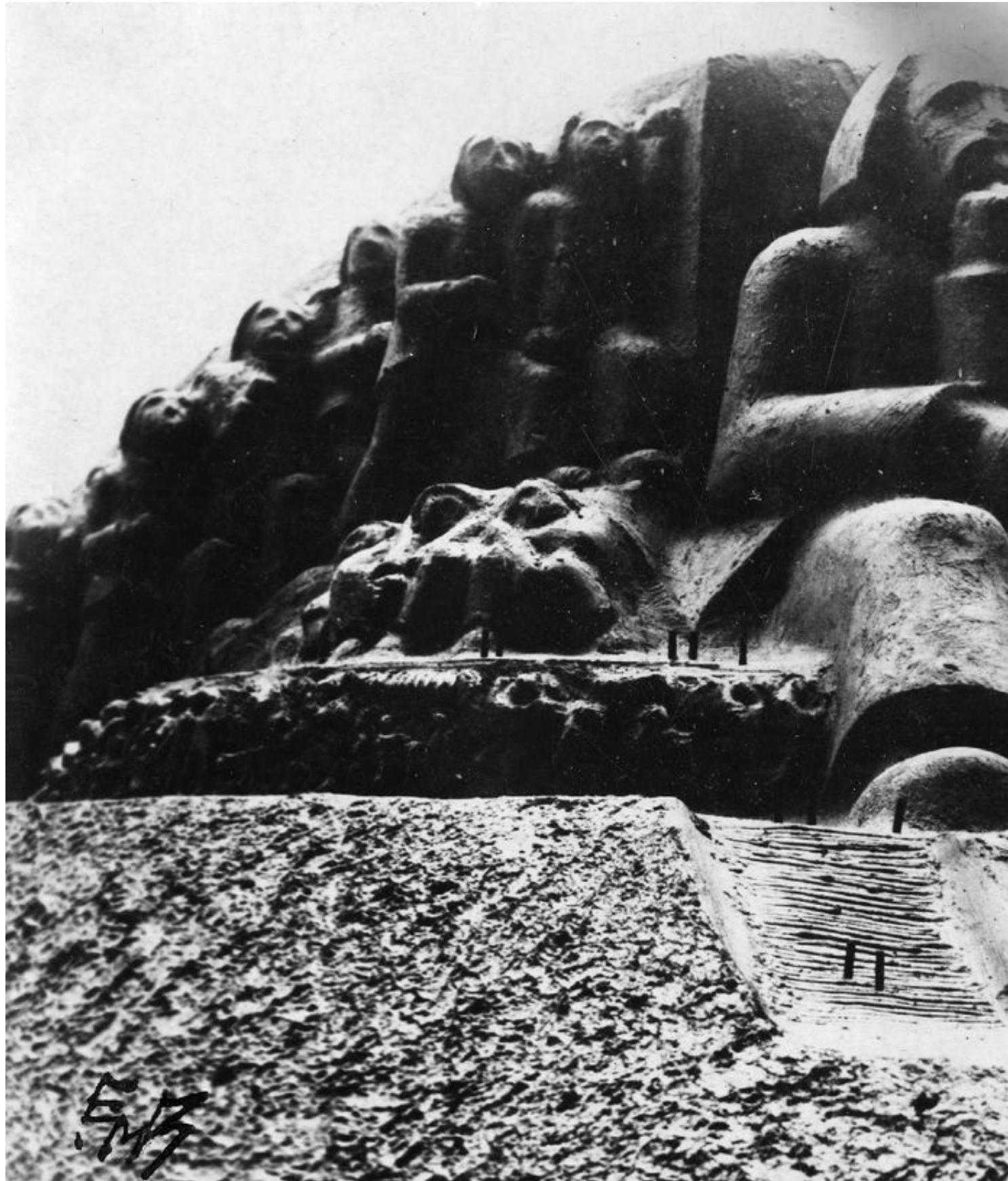
POLARMONUMENTET: Etter initiativ fra en tysk billedhugger, ble det planlagt et gigantisk monument som skulle hedre verdens polarforskere.

- Da forstår du hvorfor dette er militært område. Jeg kan medgi at det lokale militæret på 1930-tallet var «litt» skeptisk til å slippe en tysker inn på militært område. Muligens med god grunn, sier Vollset med et smil.