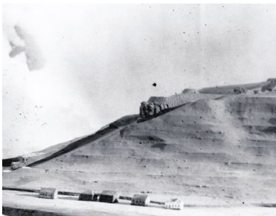
SANDVIKSFJELLET: Monumentet var planlagt på Sandviksfjellet.

- Dersom dette hadde blitt bygget, hadde det vært vanskelig å tenke på Bergen, uten å tenke på dette monumentet, sier Vollset, som mener Polarmonumentet hadde definert Bergen og at vi kanskje skal være glad for at det ikke skjedde.