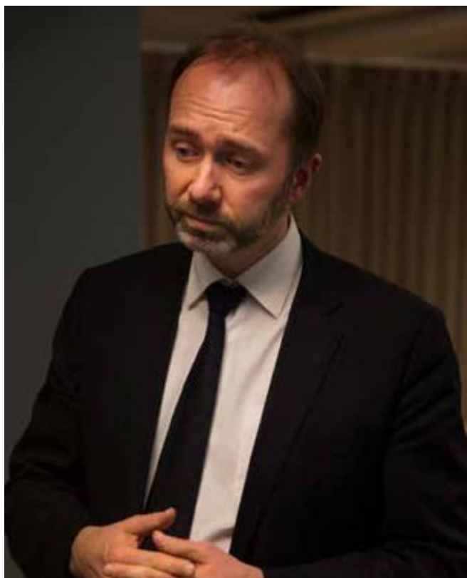
STORT PRESSEOPPBUDD: I dag er det første gang Aps tidligere nestleder, Trond Giske, står på den politiske scenen etter at han ble sykmeldt før jul som følge av varslersakene i Ap. Orkland Ap forventer et enormt presseoppbud

– Men kuldeperioden vi får nå, kommer for sent til at vi kan slå den rekorden. Da måtte vi ha begynt tidligere. Snøen blir garantert ikke liggende til begynnelsen av mai.