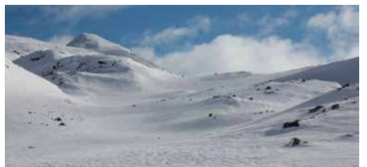
Setesdal Vesthei. I mars kom snøen i fjellet.