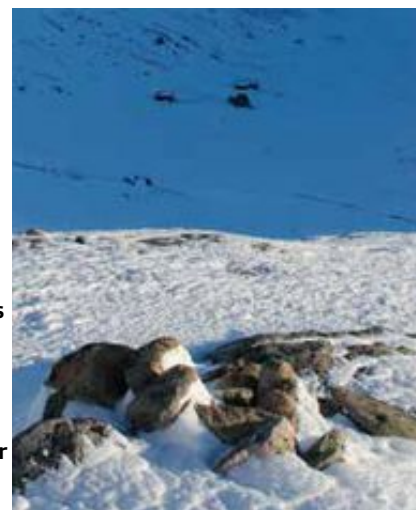
Stavskarhytta, Den norske turistforenings vesle selvbetjeningshytte mellom Berg i Valle og Bossbu. Det er snø nok til en flott påsketur nå.