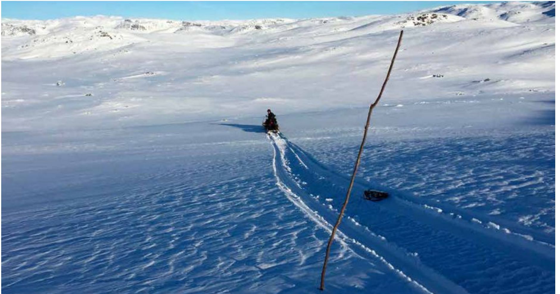
Vakre vidder med gnistrende snø. Men det var ikke mye snø her i Setesdal Vesthei i februar. 10 centimeter her – så vidt nok til at stikkene ved skiløypa mellom Øyuvsbu og Svartenut fikk feste.

← de hytteeiere både i aust- og vestheia hyttetakene med livet som innsats for å redde hyttene sine. Den gang måtte Bykle kommune utkommandere mannskaper for å hindre skoler og barnehager i å bukke under for snømengdene.