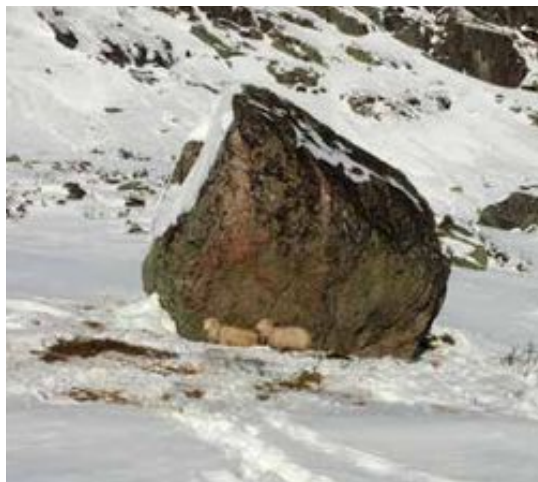
Langt ute i februar ble disse sauene funnet i live i Setesdal Vesthei. De overlevde lenge fordi det er usedvanlig lite snø i fjellet i år.