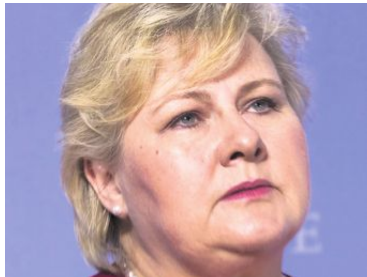
SLITER LITT: Erna Solberg fra Bergen er ikke i medvind.

Det er krampaktig av en statsminister å komme med slike karakteristikk, og det er respektløst overfor de som støtter oss og vår politikk.