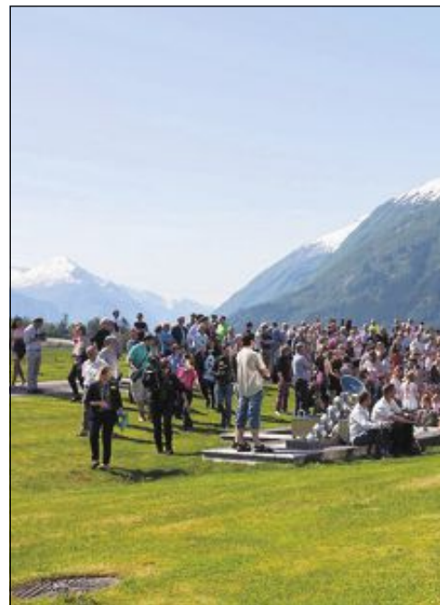
SONG: Fjærland Kammerkor underheldt utanfor Norsk Bremuseum.

- Eg har som sagt lyst å komme tilbake. Men då med familien. Og det har seg slik at eg går ein del i fjellet. Men uansett kor eg går, så har mamma vore der før, understreka kronprinsen med eit smil før han hasta vidare.