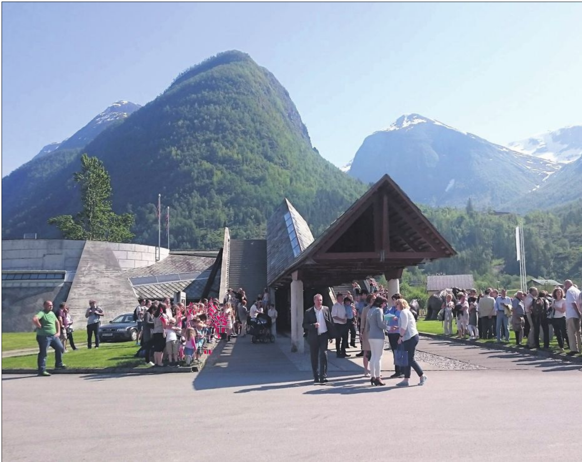
FRAMMØTTE: Det var stort fram møte av lokalbefolkninga då Kronprins Haakon fredag var på offisielt besøk i Fjærland. Norsk Bremuseum fyller 25 år i år, og det var Dronning Sonja som i 1991 opna bremuseet.