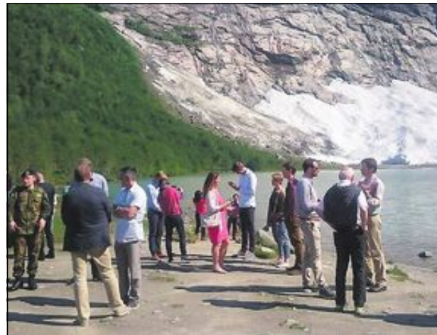
TETT PÅ: Ved Bøyabreen fekk Kronprins Haakon og følget hans komme tett på breen.