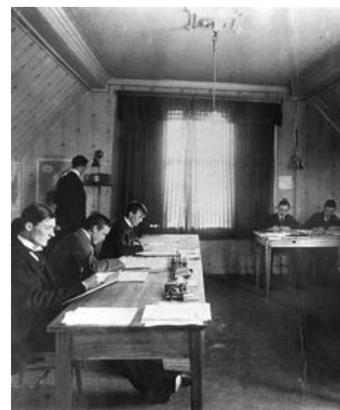
Bergensskolen innen meteorologi i 1919.