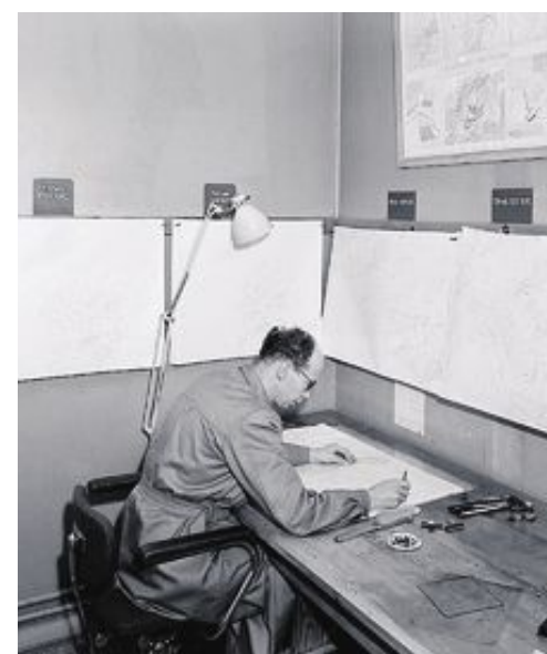
Meteorolog i arbeid på Meteorologisk institutt i Oslo i 1953.