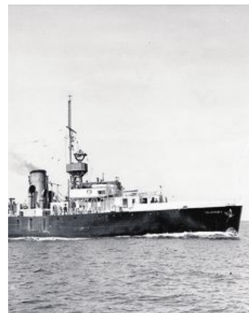
Det norske værskipet Polarfront I, en ombygd engelsk korvett, var i tjeneste fra 1948 til 1974.