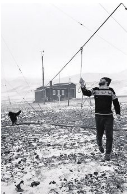
Værobservasjon på Jan Mayen ble etablert i 1921. Dette er fra 1961.

tidlig med da Det norske meteorologiske institutt ble etablert.