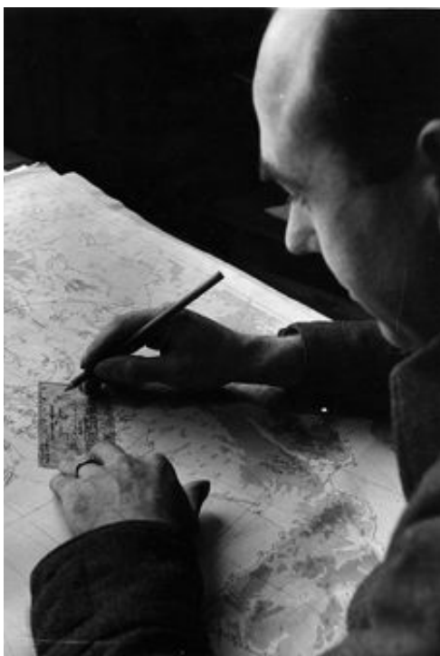
Inntegning av værddata på kart i England under andre verdenskrig.

I et internasjonalt perspektiv var Norge