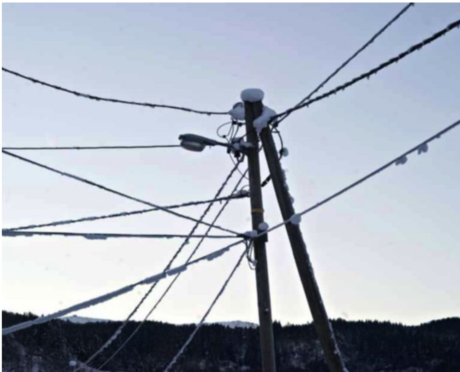
MINUS FEM: Den 4. januar ble det registrert et forbruk på i underkant av 23.000 MWh og en gjennomsnittstemperatur på minus 5,3 grader i Bergen.