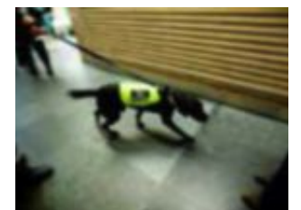
ÅTTE HUNDER: Nå jobber åtte hunder for Tollregion Vest-Norge på fulltid, det viser igjen i tallene på beslag.

På landsbasis er det gjort rekordbeslag av amfetamin. På Vestlandet har det vært en nedgang i beslag av dette stoffet.