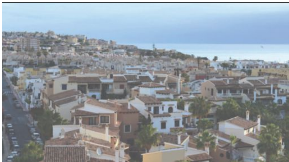
MANGE NORDMENN: Boligområde i Torrevieja, hvor mange nordmenn er bosatt, i Alicante-provinsen i Spania.