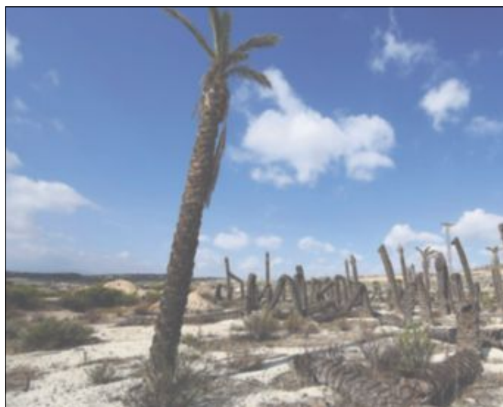
TØRKE: Palmer som har tørket i hjel ved Campos del Rio i den spanske regionen Murcia, noen mil inn i landet fra Alicante-kysten.