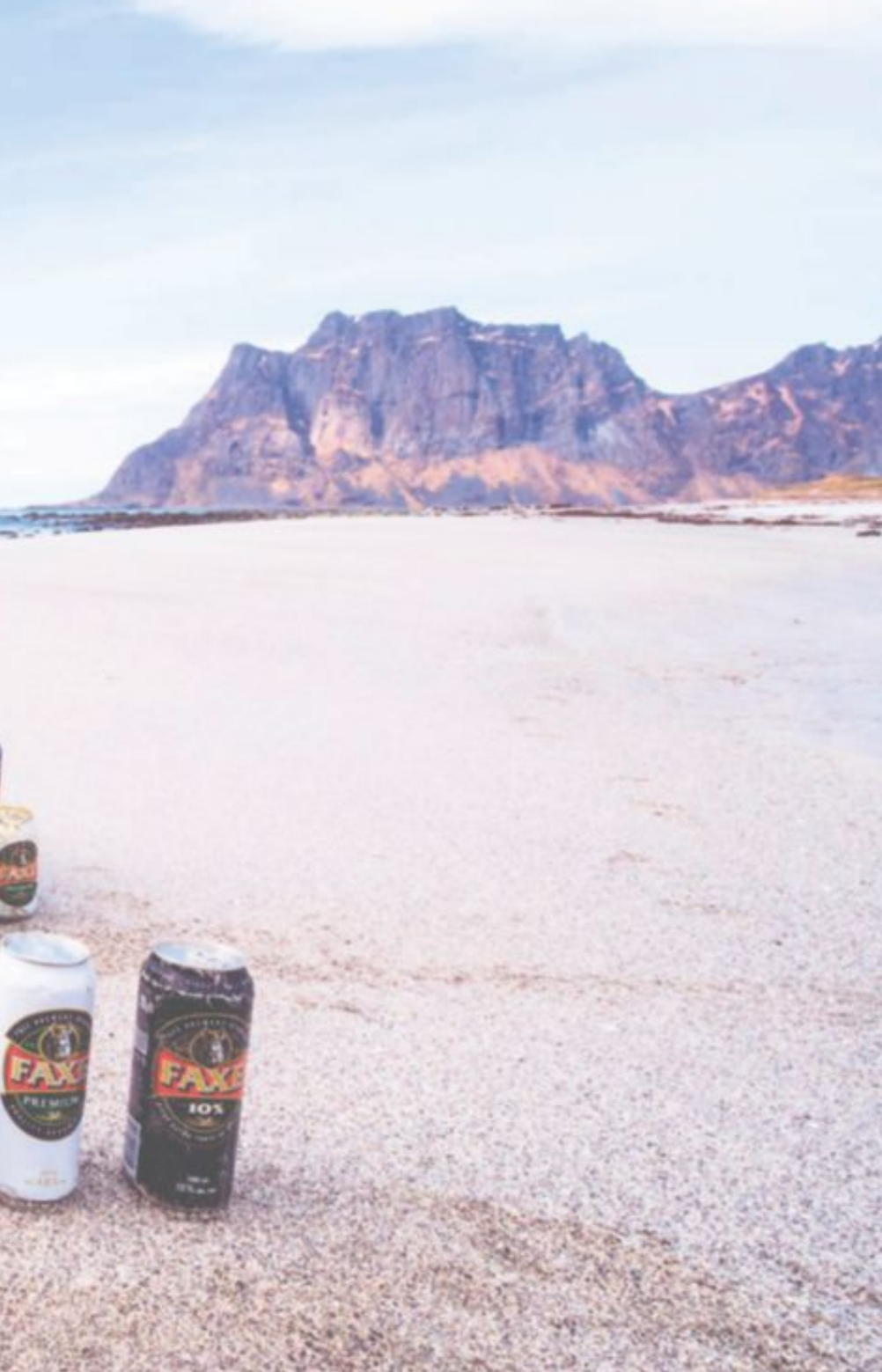
Ekstra tørst etter en tur langs stranda.