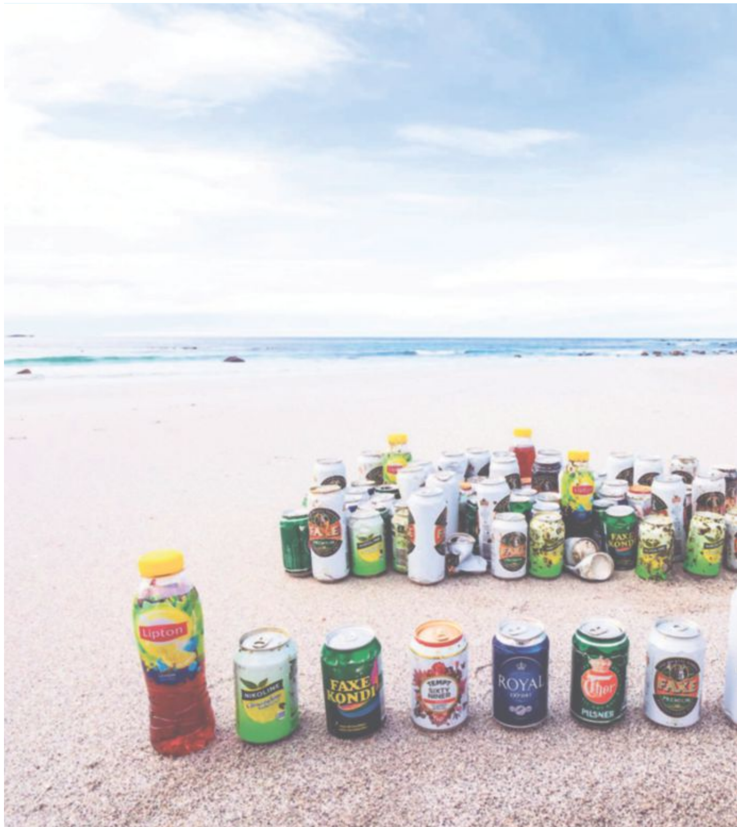
NI VARIANTER: Her ser man en del av de danske drikkevarerne som er funnet langs kysten i Lofoten. Det er nok å velge i for den som måtte være

Vind og bølgeforhold vil også ha innvirket på drivbaner og fart. Drikkevarerne kan ha forflyttet seg fra den ene delen av strømmen til den andre på grunn av vind og bølger.