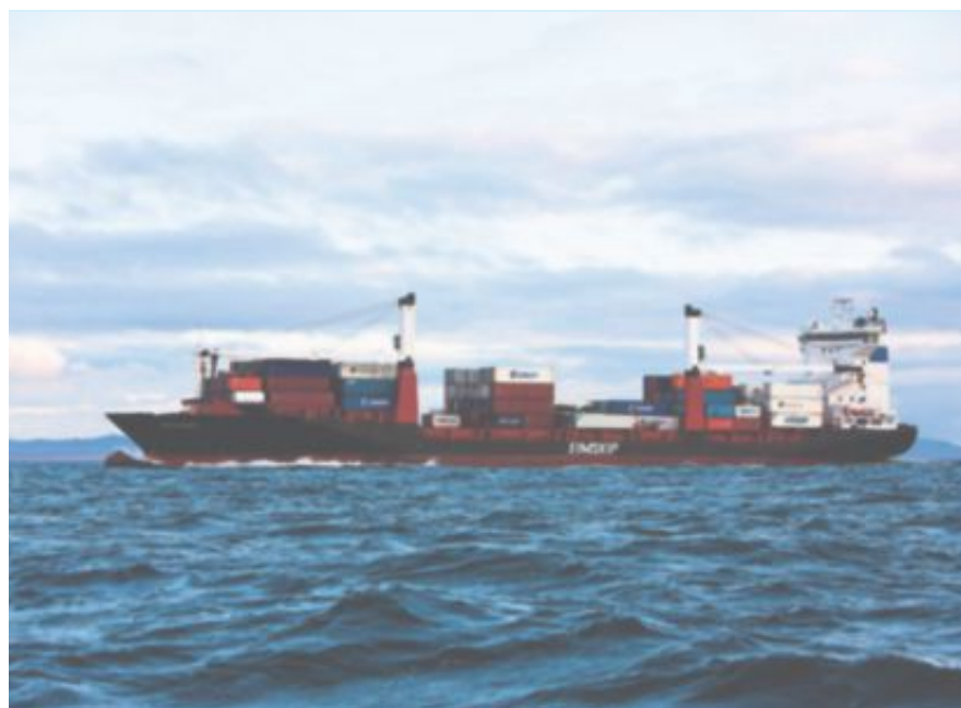
BLE TRUFFET: MS Dettifoss ble bygget i 1995, er 165,6 meter lang og 28,6 meter bred. Skipet uten last veier 14 664 tonn..