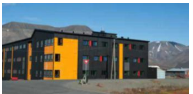
BEVÆPNEDE STUDENTER: Hyblene i nybygget er utstyrt med safe for å låse inn sluttstykket til våpenet. Skal du bevege deg utenfor Longyearbyen, er det påkrevet å ha våpen som sikring mot isbjørn.