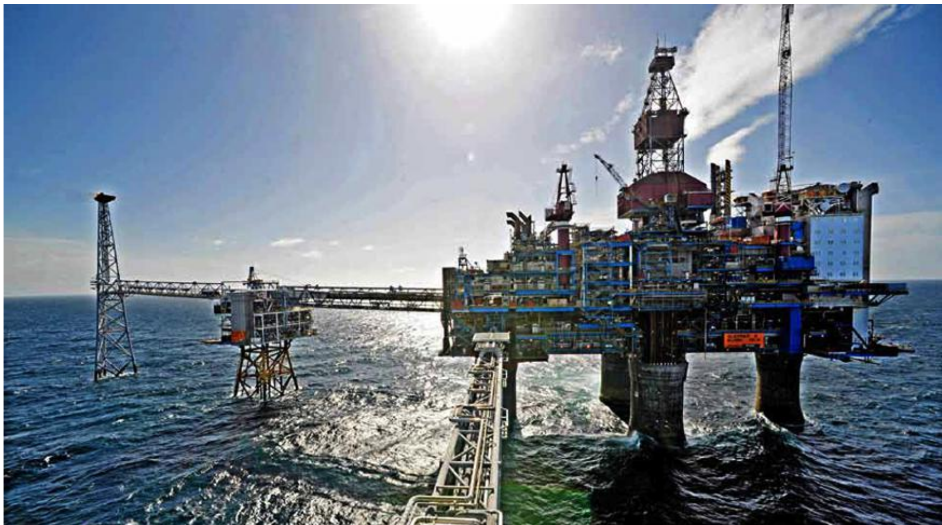
Bare åtte storskalaprojekter for karbonfangst og -lagring er i drift globalt. To av dem finnes i Norge. Her ser du Sleipner Vest, hvor CO 2 renses fra naturgass og blir injisert i Utsira-formasjonen.

Det hjelper lite å fange CO 2 dersom vi ikke samtidig står klar med sikre steder å lagre drivhusgassen på.