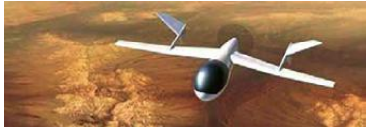
Slik ser forskerne for seg droner over Titan.

Selv om vi får til CO 2 -lagring om 20 år, vil det komme for sent til at vi kan snakke om en bro til fornybar energi. Den fornybare energien kommer mye raskere, sier han.