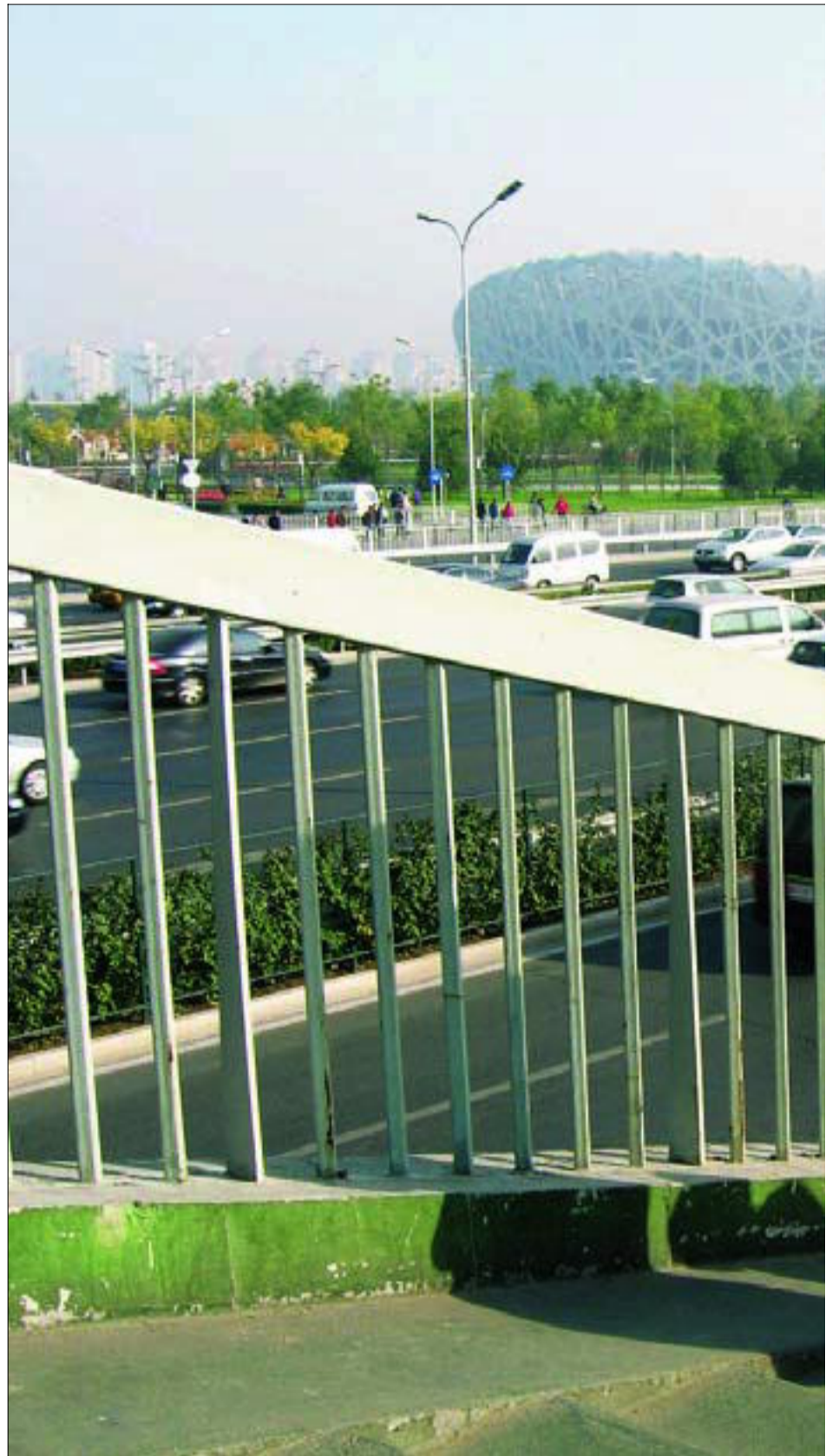
ETTER OL: Restriksjonar på biltrafikken, fleire nye metrolinjer og utflytting av industri har gitt blåare himmel over Beijing, her ved «Fuglereiret», Beijing nasjonale stadion.

Når solstrålane smyg seg ned mellom veggene i uteromma, får ho løn for sitt bidrag til betre luft i byen: For før dei olympiske leikane var det klar himmel berre ei handfull dagar kvar år – og det var helst om vinteren når vinden stod frå nord.