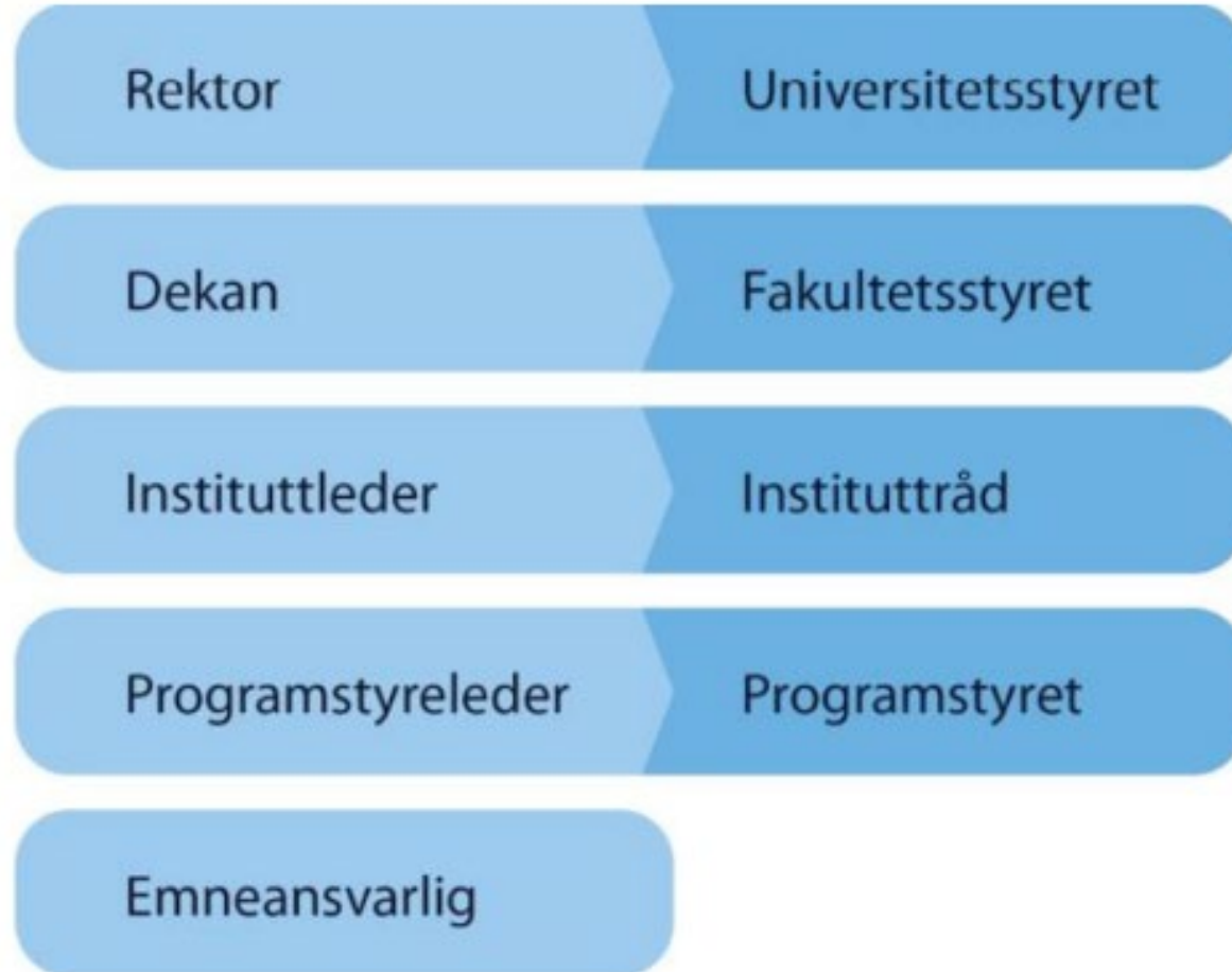
Figur 2: Ansvarsroller for det systematiske studiekvalitetsarbeidet