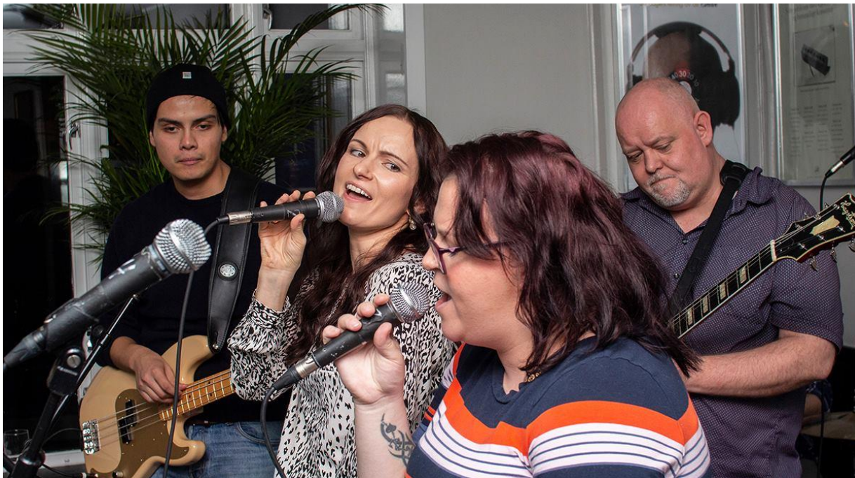
Bandet Aesthetic Minds under Musikkterapifestivalen 1-2-3 i november 2018.

I tillegg kjem ei rekkje relevante konsertar og seminar arrangerte av klyngedeltakarane sjølve.