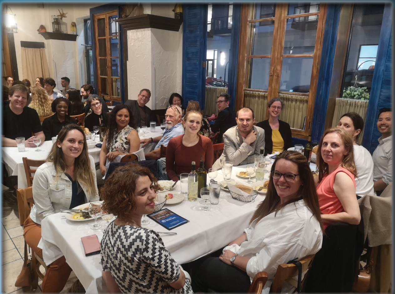
From the CNA group's conference dinner.

Nyhetsbrev fra Institutt for filosofi og førstesemesterstudier