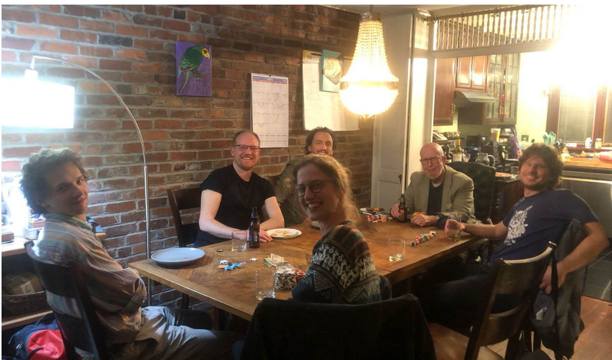
Time for some fun! Poker game with some philosopher friends.