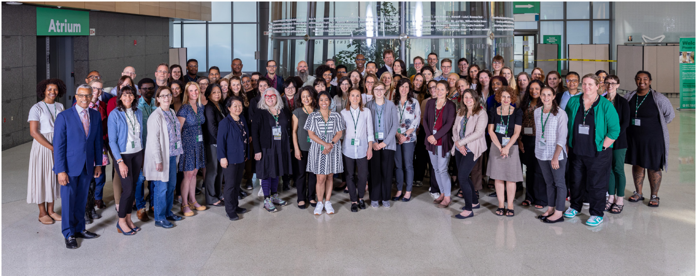
Group photo of the participants to the CNA training.

Follow the CNA group at their home page to see more about their ongoing work and about the use of the CNA method within different areas of research.