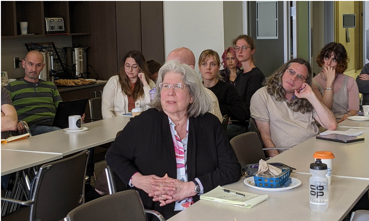
Full concentration at a lecture.