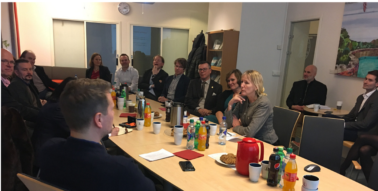
Rektoratet og dekanatet på besøk.

Når eg skriv dette, har me nettopp hatt eit vellukka besøk av rektoratet og dekanatet på instituttet. Der fekk me presentert ein del av det me held på med, og dersom nokre av gjestene hadde fordommar om filosofi og filosofar når dei kom, klarte me forhåpentlegvis å avkrefte nokre av desse undervegs. Eg trur alle som var der vil vere samde i at me framstod som eit institutt det er god grunn til å vere stolt av.