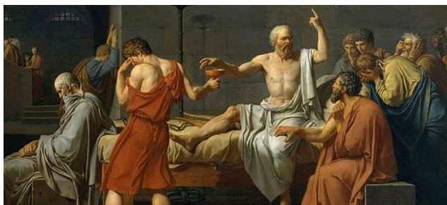
Fra sist møte i fagutvalget

Interesserte studenter oppfordres i den anledning til å melde seg som innleggsholdere, med fritt valgt filosofisk tema.