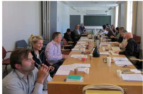
Fra Symposium-konferansen i juni

Antikkgruppen ved FoF ser allerede frem til neste års konferanse. Da skal Platons dialog Sofisten legges under lupen.