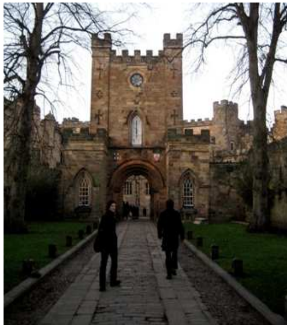
University of Durham

kontinentale og den analytiske tradisjonen. Dette ble, ikke uventet, et diskusjonstema, men alle var åpne og oppriktig interessert, og vi ble både utfordret og støttet på våre respektive innlegg.