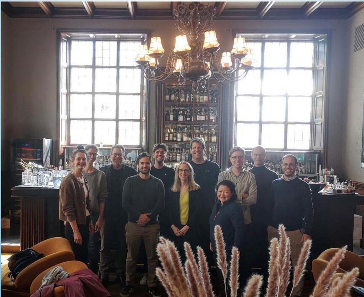
Coincidence Analysis (CNA)-gruppen på Terminus