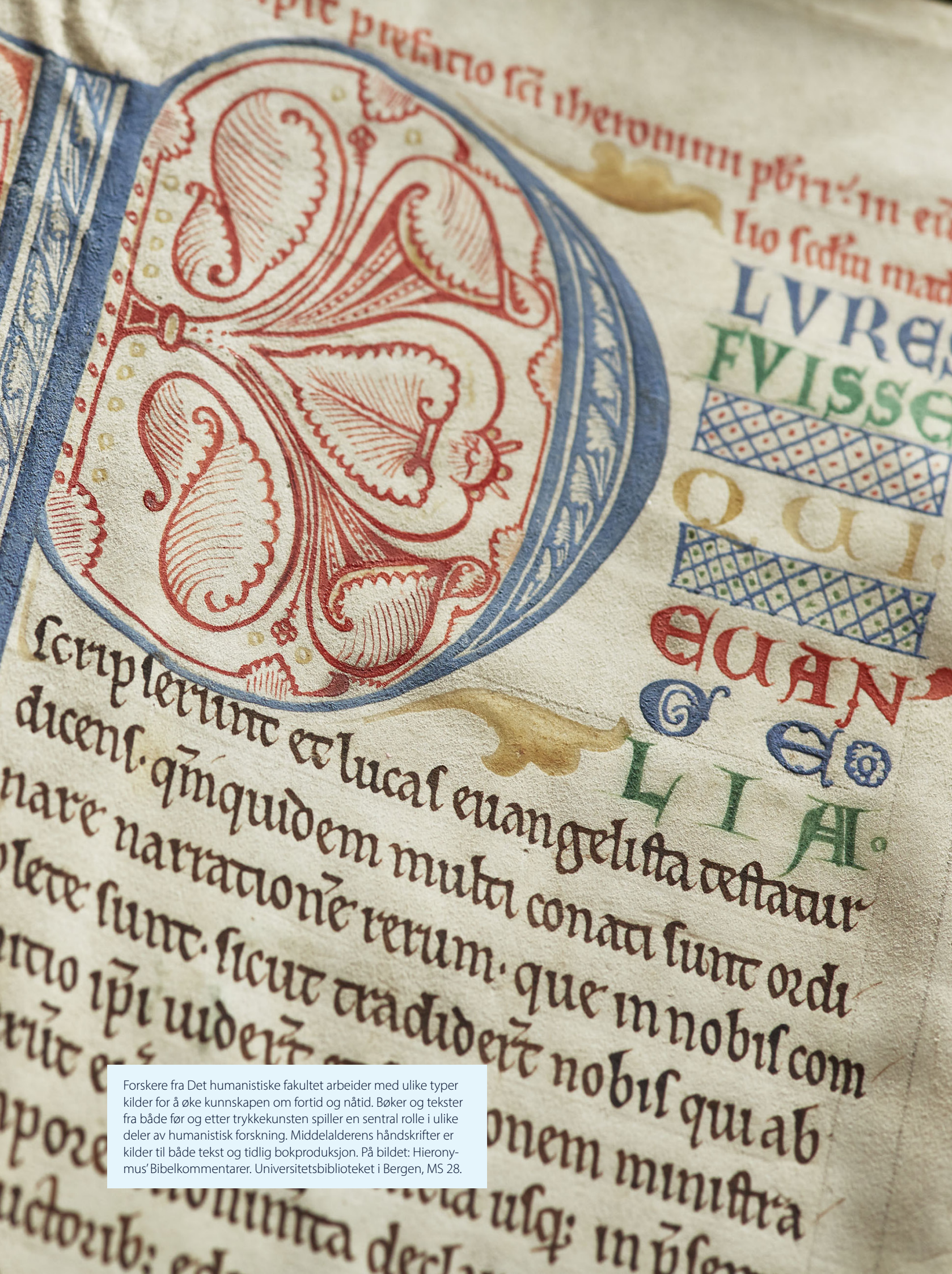
Forskere fra Det humanistiske fakultet arbeider med ulike typer kilder for å øke kunnskapen om fortid og nåtid. Bøker og tekster fra både før og etter trykkekonsten spiller en sentral rolle i ulike deler av humanistisk forskning. Middelalderens håndskrifter er kilder til både tekst og tidlig bokproduksjon. På bildet: Hieronymus' Bibelkommentarer. Universitetsbiblioteket i Bergen, MS 28.