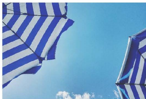
Word stock image

Interested in joining the Sustainability Team?