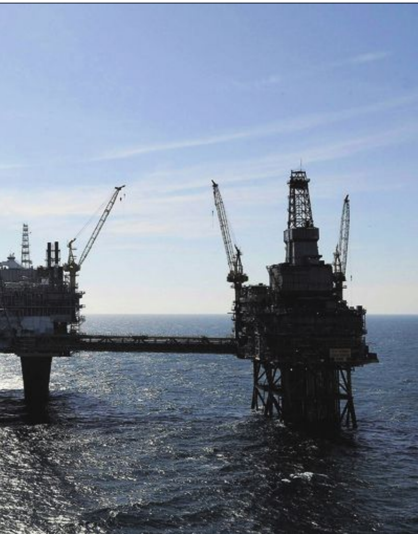
SIER NEI: Oljen representerer risiko for kommende generasjoner.

Oljeinvesteringer er en økende økonomisk risiko fordi staten fremmer leteboring og dekker leteutgifter. Skatteordningene for oljenæringa medfører at staten finansierer nesten 90 prosent av investeringene ved utbygging og leting mot at selskapene betaler 78 prosent skatt av et eventuelt overskudd. Dette gjøres til tross for at det aller meste av kjente fossile ressurser ikke kan utvinnes hvis verden skal unngå klimakollaps. Skal vi nå FN's klimamål, blir en stor del av norske fossile reserver verdiløse.