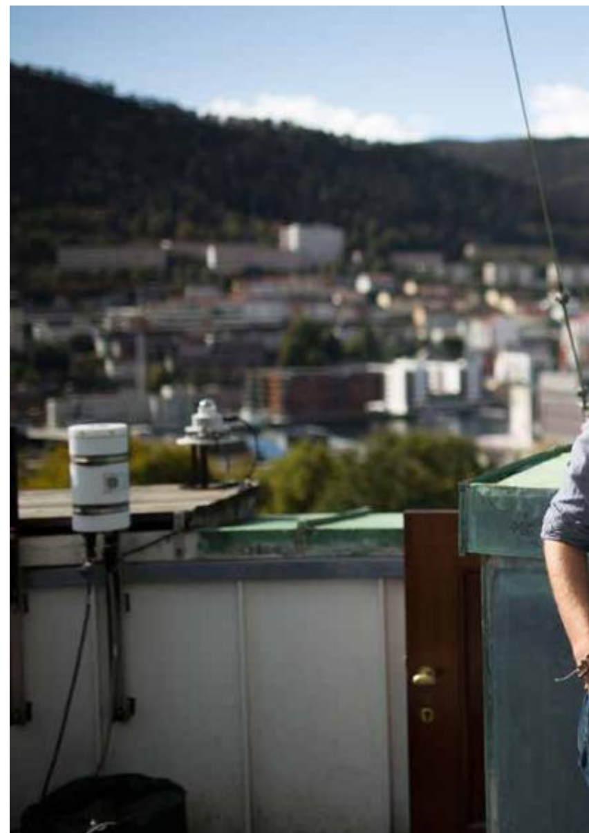
KLIMAVARSLER: – Fridtjof Nansen hadde neppe forestilt seg de dramatiske klima- 100-årsjubileum i år.

Men Norge er Norge, så sider ble det altså ikke. Men den helnorske eplejuicen var nydelig, det skal sies.