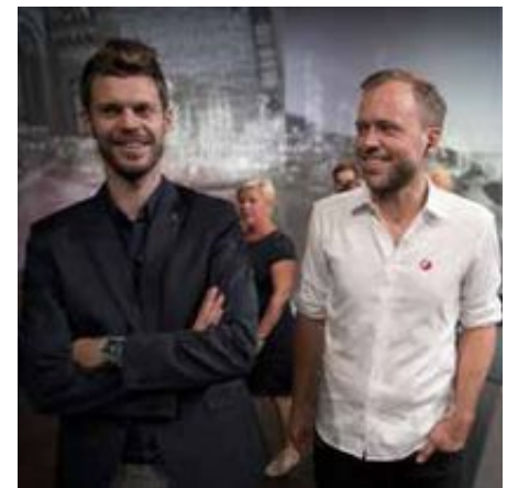
UTSPILT: Den norske partifloraen med utallige småpartier har utspilt sin rolle, mener innsender.

DEN NORSKE PARTIFLORAEN med utallige småpartier har utspilt sin rolle. Vel kan det sikkert være morsomt å ligge og vake rundt sperregrensen, og med maksimal flaks svelge så mange kameler, sjiraffer og andre tungt fordøyelige dyr at du får noen år i limousin med privatsjåfør og kakeslabberas med Erna hver fredag, men det politiske landskapet trenger