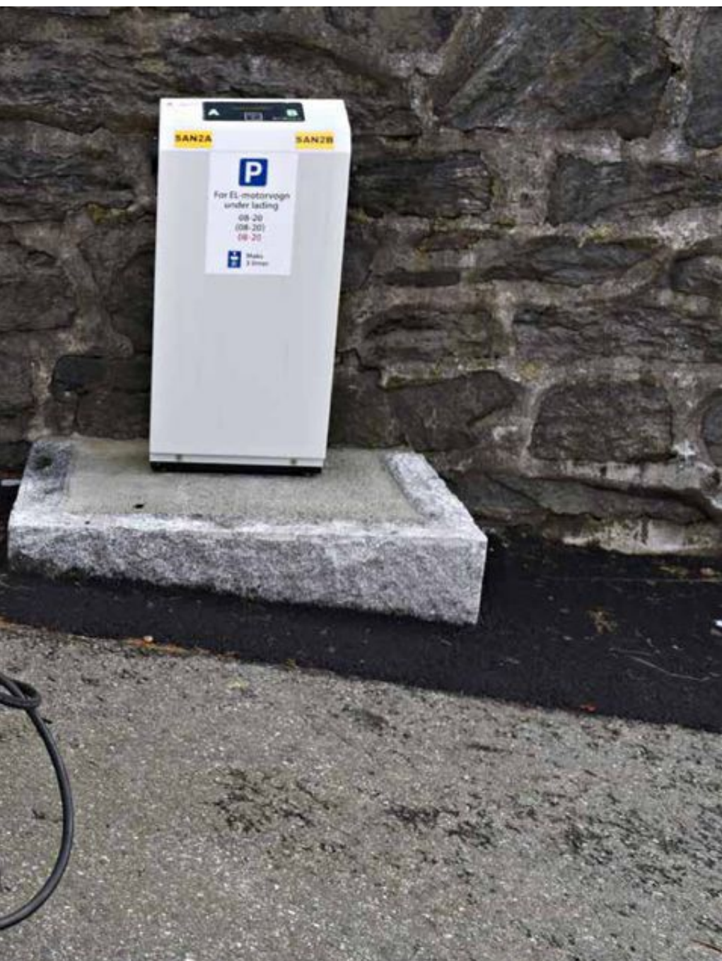
talet på elbilar, skriv innsendarane.