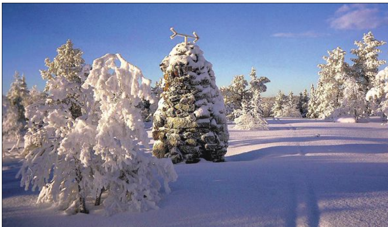
FLOTT: Tom Helgesen har tatt dette bildet i 2000. Hvordan blir det i 2050?