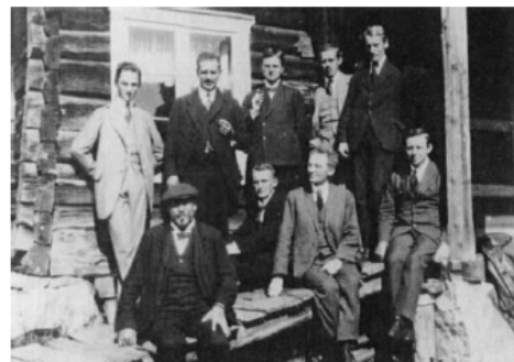
Første møte på Geilo 18-20 august 1917

Velkommen til tre spennende dager med friske foredrag, en fantastisk festmiddag, mye sosialt samvær og en tur til fjells.