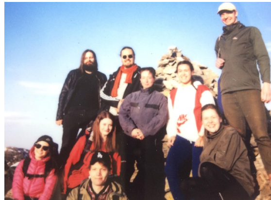
En glad forsamling filosofistudenter på hyttetur

I april dro en god gjeng filosofistudenter på en hyttetur til Turnerhytten på Ulriken. Tolvte april pakket vi pensum vekk noen dager og reiste ut av bykjernen for å feire oss selv, og hverandre, som vier vår tid til filosofiske undersøkelser. Det ble en gyllen mulighet til å senke skuldrene og lade opp til den kommende eksamensperioden med leker, grilling, brettspill og alkoholrelatert aktivitet på et av de vakreste byfjellene Bergen har å tilby.