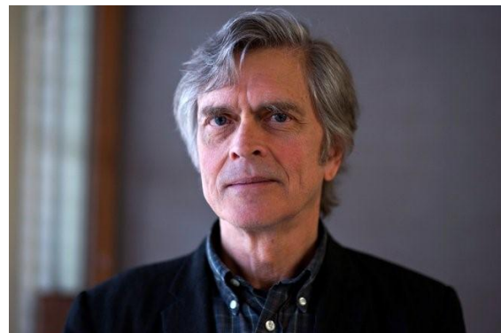
Professor Jeff McMahan

Jeff McMahan , White's Professor of Moral Philosophy ved Universitetet i Oxford og en av vår tids ledende moralfilosof holdt foredraget " Is it permissible to eat animals that have been humanely raised? " 17. januar.