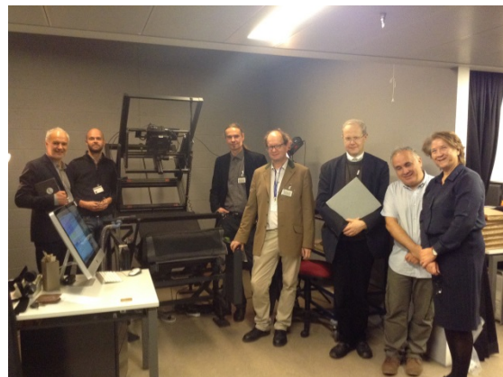
Delegasjonen inspiserer scannearbeidet ved Bodleian Library i Oxford.