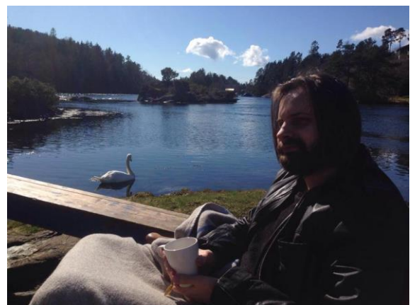
Bildene er fra studentenes hyttetur dette semesteret.