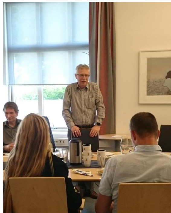
Instituttleder oppsummerer semesteret på sommeravslutningen

FoF har vært gjennom en ganske omfattende endringsprosess. De som har vært med å bygge opp instituttet til det det er i dag har nå gått av med pensjon, men vi kan glede oss over at vi har fått svært mange nye yngre og dyktige kolleger. I de neste årene vil det (heldigvis) være nokså stabile forhold ved FoF. HF som fakultet setter nå i gang sin endringsprosess, både i forhold til strukturen i studieplanene og hvordan personalressurser skal fordeles. Selv om denne også angår oss, er det vanskelig å se at vi vil komme dårlig ut av en omstrukturering, nesten uansett hvordan den måtte se ut. FoF skiller seg på mange måter fra de andre instituttene ved HF: våre undervisningsoppgaver retter seg først og fremst mot studenter ved fakulteter utenfor HF, vår forskning er i stor grad tverrfaglig og tverrfakultær, og på mange måter har vi sterkere bånd til institutter ved SV enn ved HF. Vår strategi nevner muligheten for en spesialisering i «Philosophy and Public Policy» som vil omfatte samarbeid med økonomi og statsvitenskap. En slik spesialisering i vår mastergrad vil gjøre våre kandidater mer attraktive på arbeidsmarkedet, og vil kunne rekruttere flere utenlandske studenter. Spesialiseringen vil også kunne styrke eksisterende samarbeid med miljøfagene og helsefagene ved UiB, ikke minst i forhold til den planlagte helseklyngen på Årstadvollen. Til tross for den vanskelige økonomiske situasjonen ved HF for tiden, har FoF et solid fundament for fortsatt vekst.