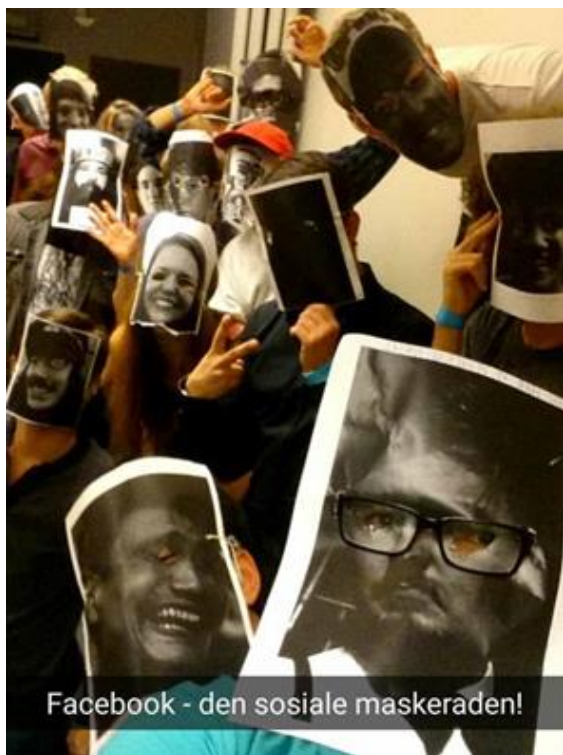
Fra fadderuken høsten 2015

hvor de fikk se både Wittgensteinarkivet og masterlesesalene. Den siste kvelden hadde vi filosofileker i en forelesningssal på instituttet. I det ene rommet ble man delt inn i to grupper, der den ene siden skulle prøve å bygge opp en definisjon mens den andre gruppen skulle prøve å bryte den ned. I det andre rommet satt en og en filosofistudent overfor hverandre og byttet på å argumentere for eller mot en påstand, slik man skal ha gjort på skolen i Athen i Platons tid. Senere på kvelden var det utkledningsfest på Bryggen Nightclub, hvor temaet var maskerade. Filosofifaddergruppen bestemte seg for å gi temaet en unik vri, ved å omformulere temaet til "Facebook, den sosiale maskeraden". Studentene printet dermed ut kopier av sine egne profilbilder, som de festet til seg selv. Det samfunnskritiske og humoristiske innslaget ble tatt vel imot av andre medstudenter på Bryggen Nightclub. I det hele tatt var det en svært underholdende og spennende uke, både for fadderbarn og faddere, og vi i fagutvalget håper at det gjør sitt til å styrke studentmiljøet og forhåpentligvis minke frafallet. Vi tror også at denne uken gjorde sitt til at antall medlemmer i fagutvalget nå er det høyeste på svært lenge.