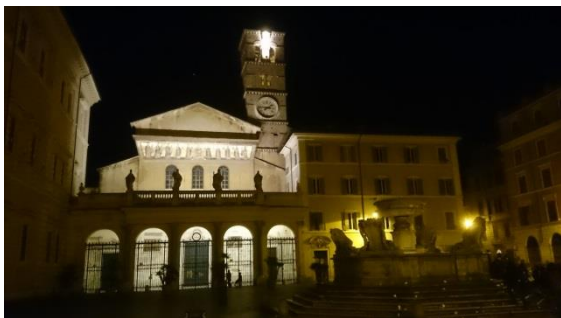
Kirken Santa Maria in Trastevere

Forskergruppen for subjektivering og senmodernitet holdt seminar ved Det norske institutt i Roma 25., 26. og 27. mars, nok en gang med over 20 deltakere. Temaet for seminaret var: