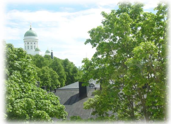
Den Lutheranske katedralen i Helsingfors, sett fra Von Wright- og Wittgensteinarkivet ved Helsingfors universitet (WWA). WWA huser en stor del av dokumentene som er brukt i NFR-postdoc-prosjektet "Shaping a Domain of Knowledge by Editorial Processing: the Case of Editing Wittgenstein's Work" (NFR: 213080).