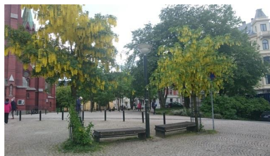
Ikke fullt så solfylt men sommerlig likevel.

Alle innleggene er torsdager 14:15-16:00 på rom 210, Sydneplassen 12/13. Følg med i FoFs kalender når det gjelder titler og abstracts for de ulike innleggene.