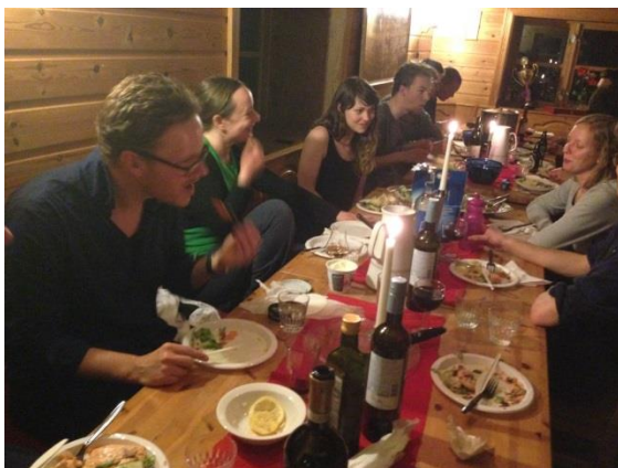
God stemning på studentenes hyttetur (Turnerhytten)

Torsdag 23. april dro femten filosofistudenter på hyttetur til Turnerhytten på Ulriken. Bachelor-, master- og stipendiatnivå var alle representert. Som kjent skrev Henrik Ibsen Vi vandrer med freidig mot i 1853 etter en av de første borgerturene opp Ulriken. Størsteparten av turfølget gikk fra nedre stasjon, mens noen valgte å ta banen opp. Turfølget var tungt lastet med mat og drikke før de tok fatt på en relativ kort vandring over den faktiske toppen av Ulriken på vei inn til hytta. Det var fremdeles snø å traversere, så mange ble våte på beina.