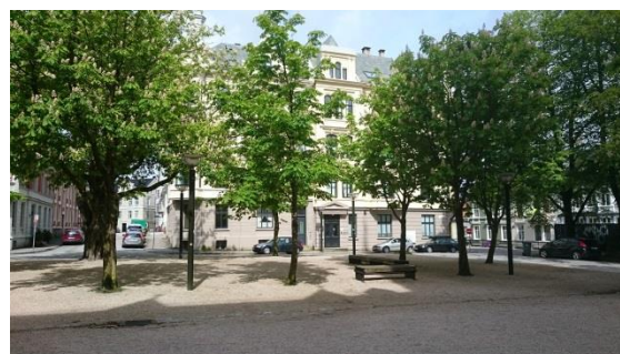
Plassen utenfor instituttet på en solfylt dag.