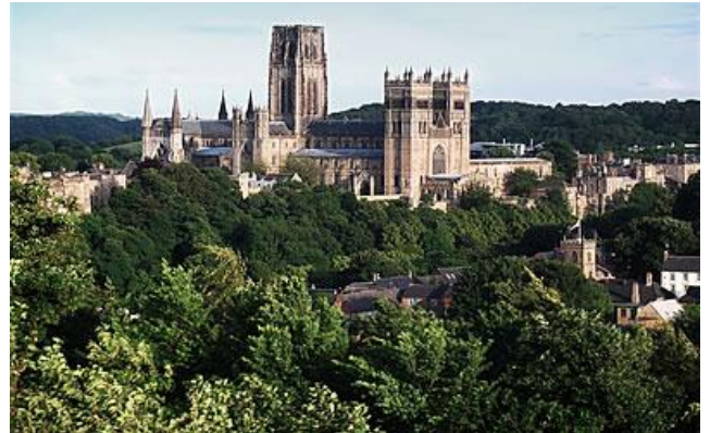
Bilde av University of Durham (Gavin Orland)