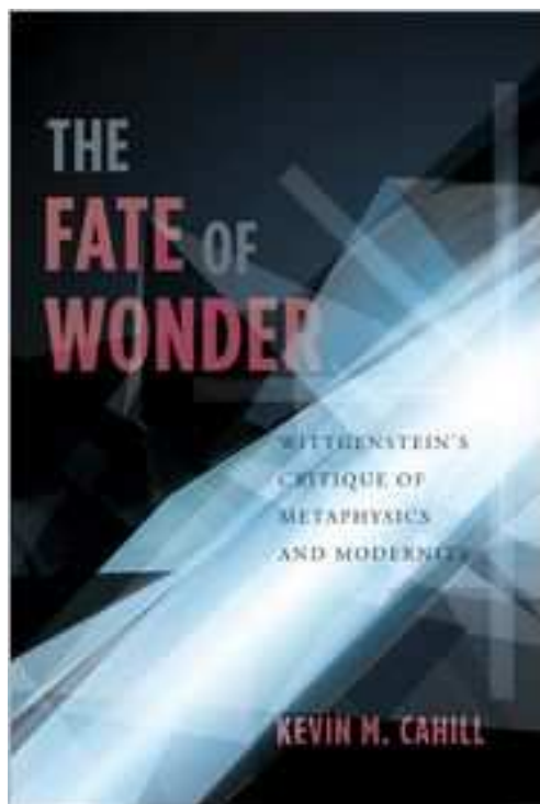
Rett fra trykken: The Fate of Wonder

http://cup.columbia.edu/book/978-0-231-15800-8/the-fate-of-wonder