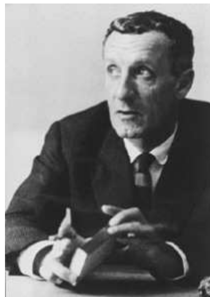
Maurice Merleau-Ponty (1908-1961)

I forbindelse med markeringen av Maurice Merleau-Pontys hundreårsdag arrangerte SKOK og FoFs forskergruppe for fenomenologi og eksistensfilosofi et minneseminar med gjester av høyt internasjonalt kaliber.