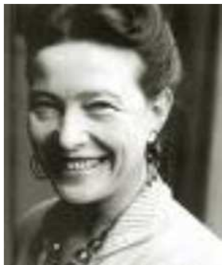
Simone de Beauvoir (1908 - 1986)

Det er i år 100 år siden Simone de Beauvoir ble født, og seminaret står altså i hennes tegn.